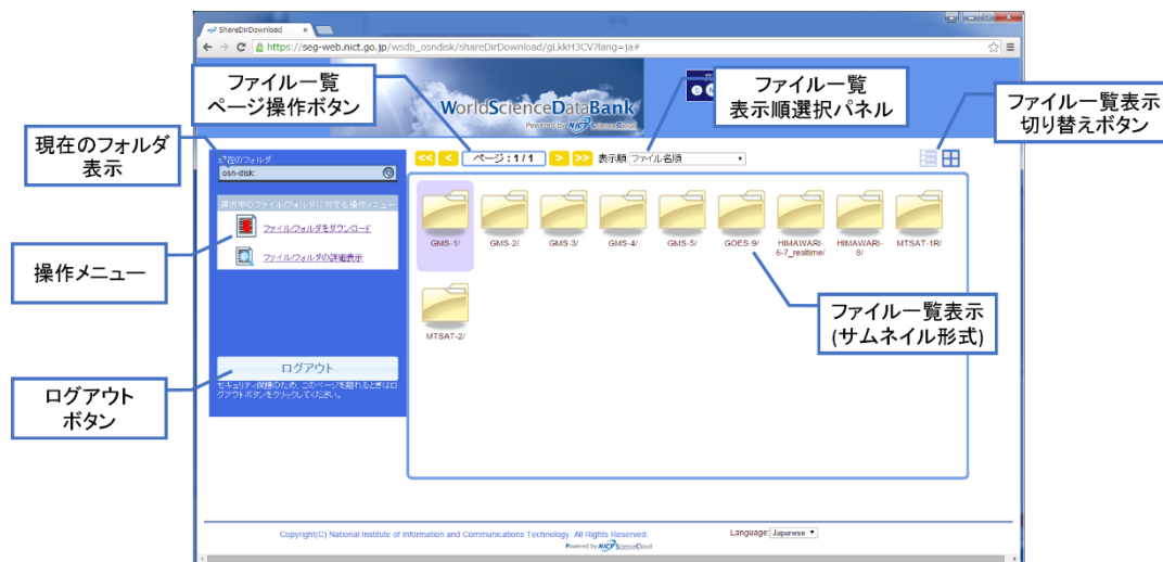
図 2-1 ダウンロード画面(サムネイル形式)